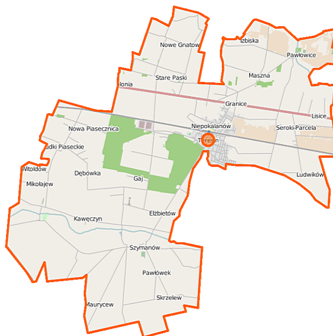
Rysunek 1. Gmina Teresin

Gmina Teresin zajmuje obszar 87,98 km 2 . Według danych GUS na koniec 2016 roku Gmina liczyła 11.438 mieszkańców, a gęstość zaludnienia to 130 osób/km 2 . Gmina Teresin leży w środkowej części powiatu sochaczewskiego.