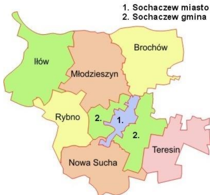
Rysunek 1. Teresin na tle powiatu sochaczewskiego

Gmina Teresin położona jest w województwie mazowieckim, w powiecie sochaczewskim. Oddalona jest od Sochaczewa o około 14 km i od Warszawy o około 55 km, dlatego też pozostaje w obszarze bezpośrednich wpływów obu miast (społecznych, ekonomicznych, rekreacyjnych i infrastrukturalnych). W skład gminy wchodzi 28 sołectw, zaś terytorium gminy obejmuje obszar 88 km 2 .